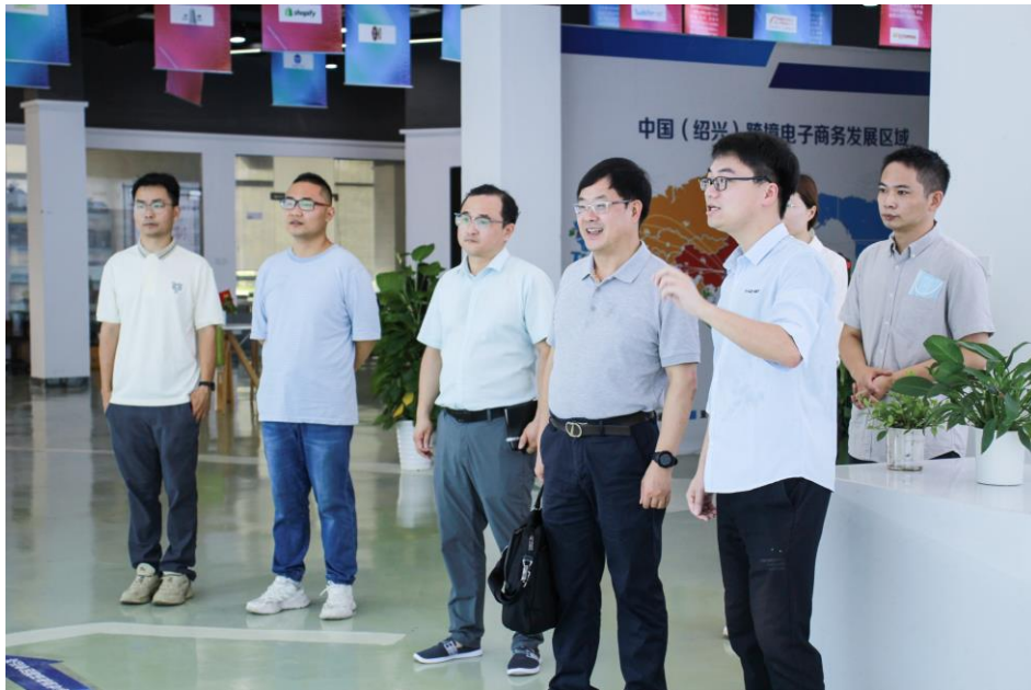
图 3：学院领导走访校企合作企业

充分发挥校领导班子成员带头做好毕业生就业工作的重要示范作用，圆满完成“书记校长访企拓岗促就业”专项活动，带动学校全员深度参与做好毕业生就业工作。截止 2023 年 10 月，学院领导班子和各系领导共计走访各类企业 455 家，积极为毕业生挖潜创新开拓岗位。