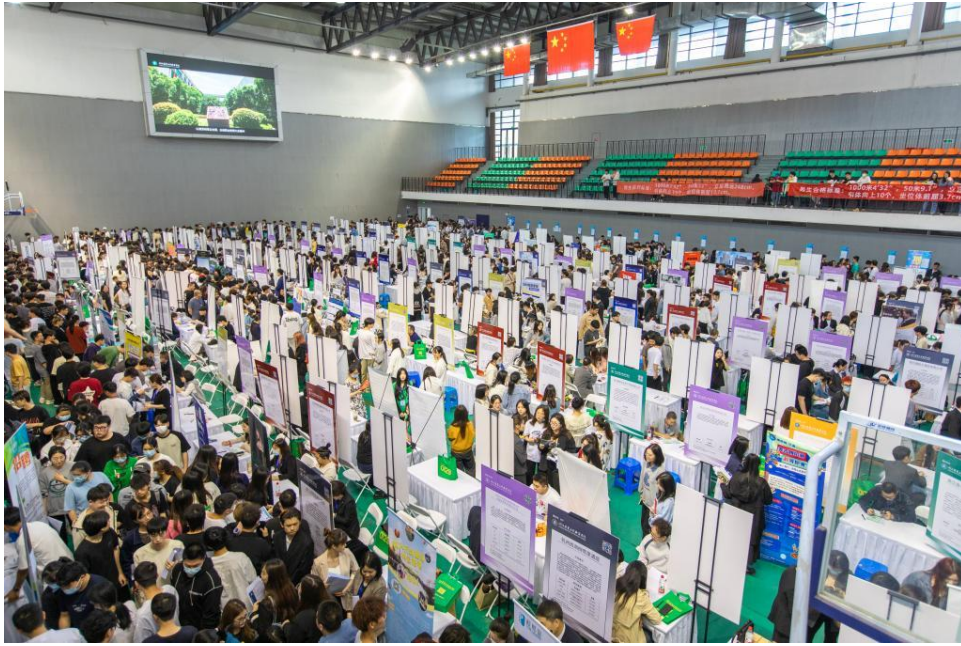
图 5：2023 年校园招聘会现场