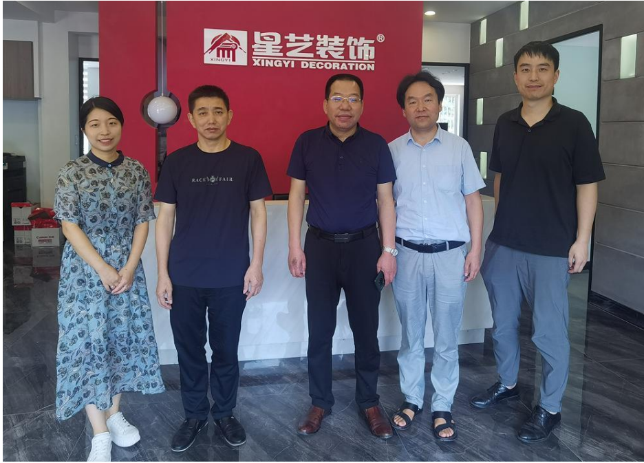
图 4：学院领导走访校企合作企业