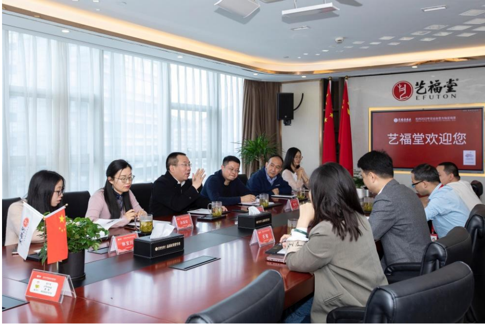
图 4：学院领导走访校企合作企业

以访企拓岗为契机，深化校企合作和供需对接，充分拓宽毕业生就业渠道，深挖就业岗位，帮助毕业生增加就业机会，助推学生高质量就业。2022 年，书记校长共走访校企合作单位 120 余家，超额完成访企拓岗工作任务。