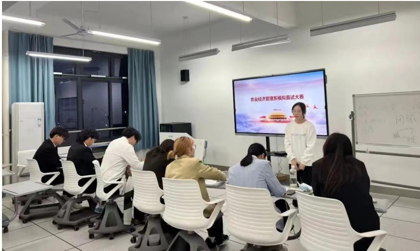
图 5：模拟面试比赛现场

此外，学院严格落实教育部“四不准”要求，引导学生诚信签约。规范做好就业统计工作，建立逐级审核、核查报送的工作机制，指定专人负责，对所有毕业生就业上报信息进行严格核查。确保每一条就业信息准确无误，确保就业统计数据真实有效。